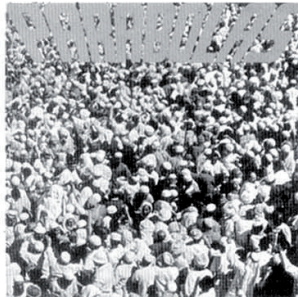
LP 113 LC Cassettes 5 LC PARABOLAS Francisco Palazón - José Antonio Olivar